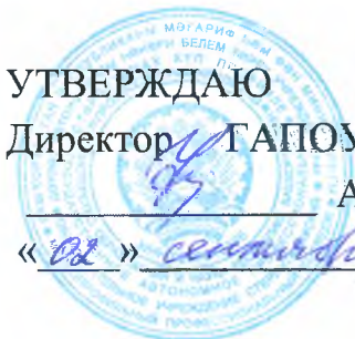
ГРАФИК ПРОМЕЖУТОЧНОЙ АТТЕСТАЦИИ группы Д-3-22 профессии 46.01.03 Делопроизводитель на 1 полугодие 2024 – 2025 учебного года